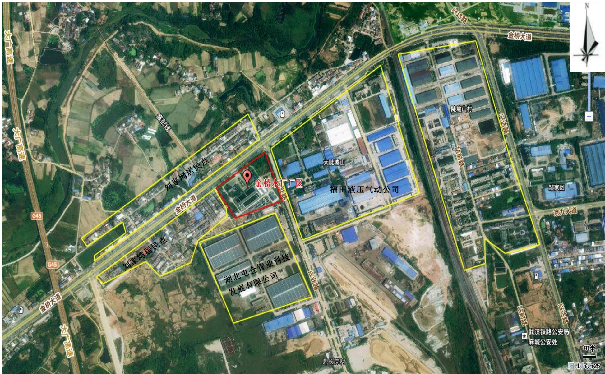
附图3 项目周边环境关系示意图