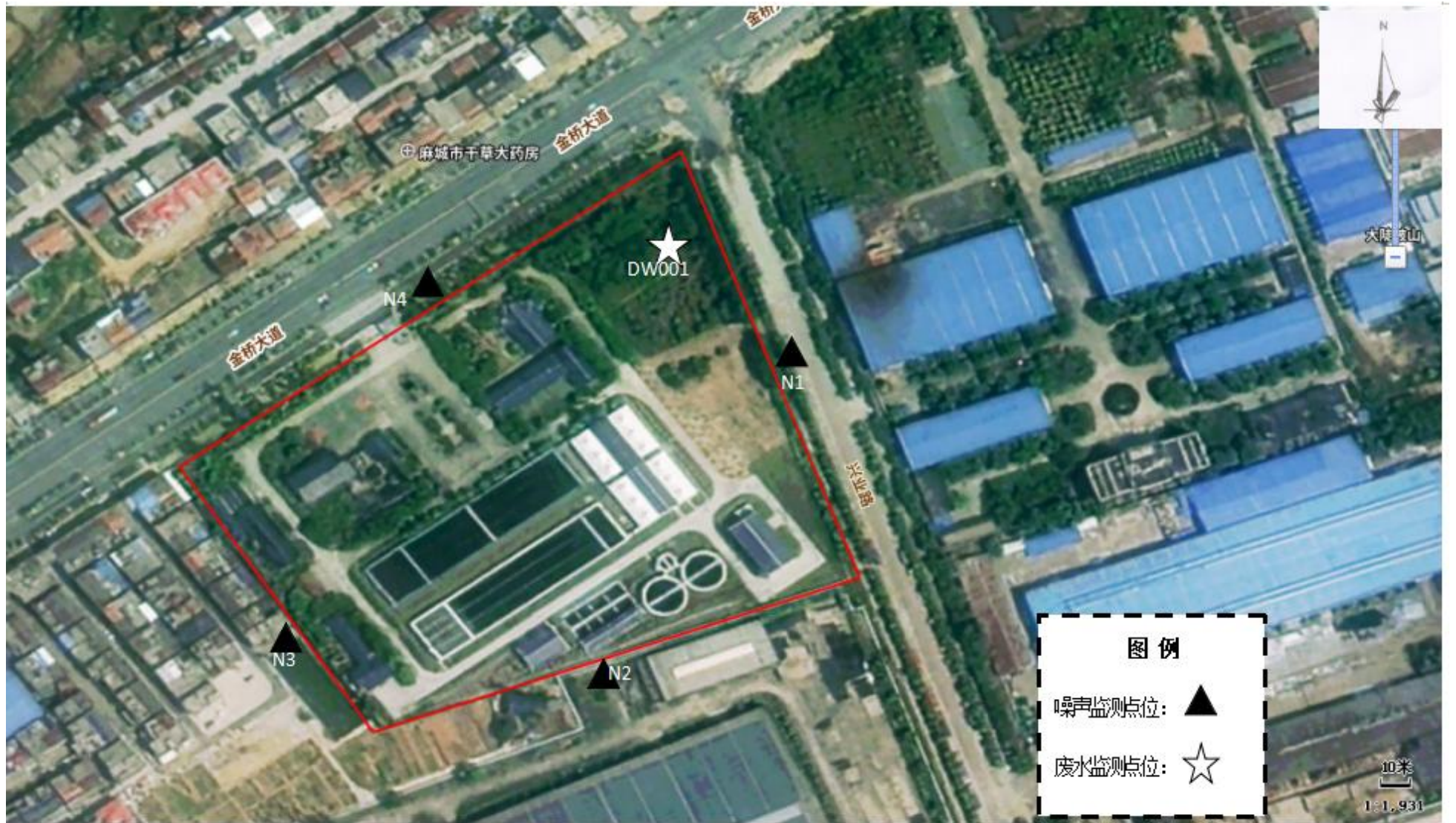
附图 6 项目验收监测点位示意图